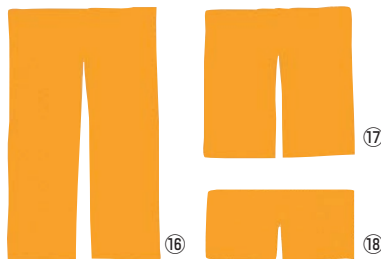
半間用 無地 のれん あかね