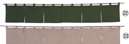
綿麻無地 のれん 001-09