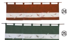
のれん 松葉ちらし 118-01