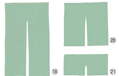
半間用 無地 のれん グリーン